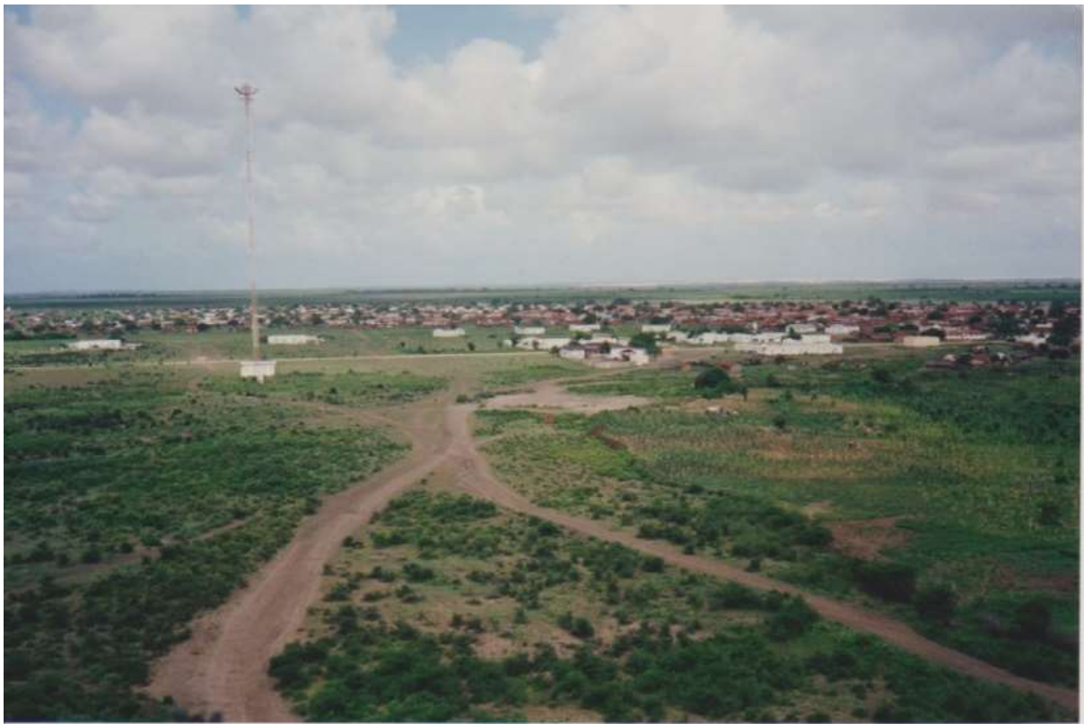
Zicht op vliegveld van KISMAYO.