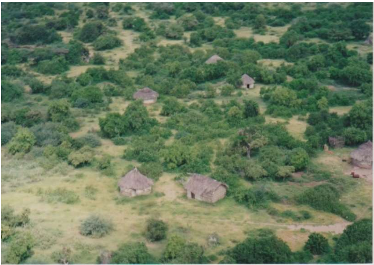
Hutten in de omgeving van het vliegveld van KISMAYO.