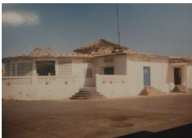
De ploeg en gebouw van Radio Hope in de haven van KISMAYO.