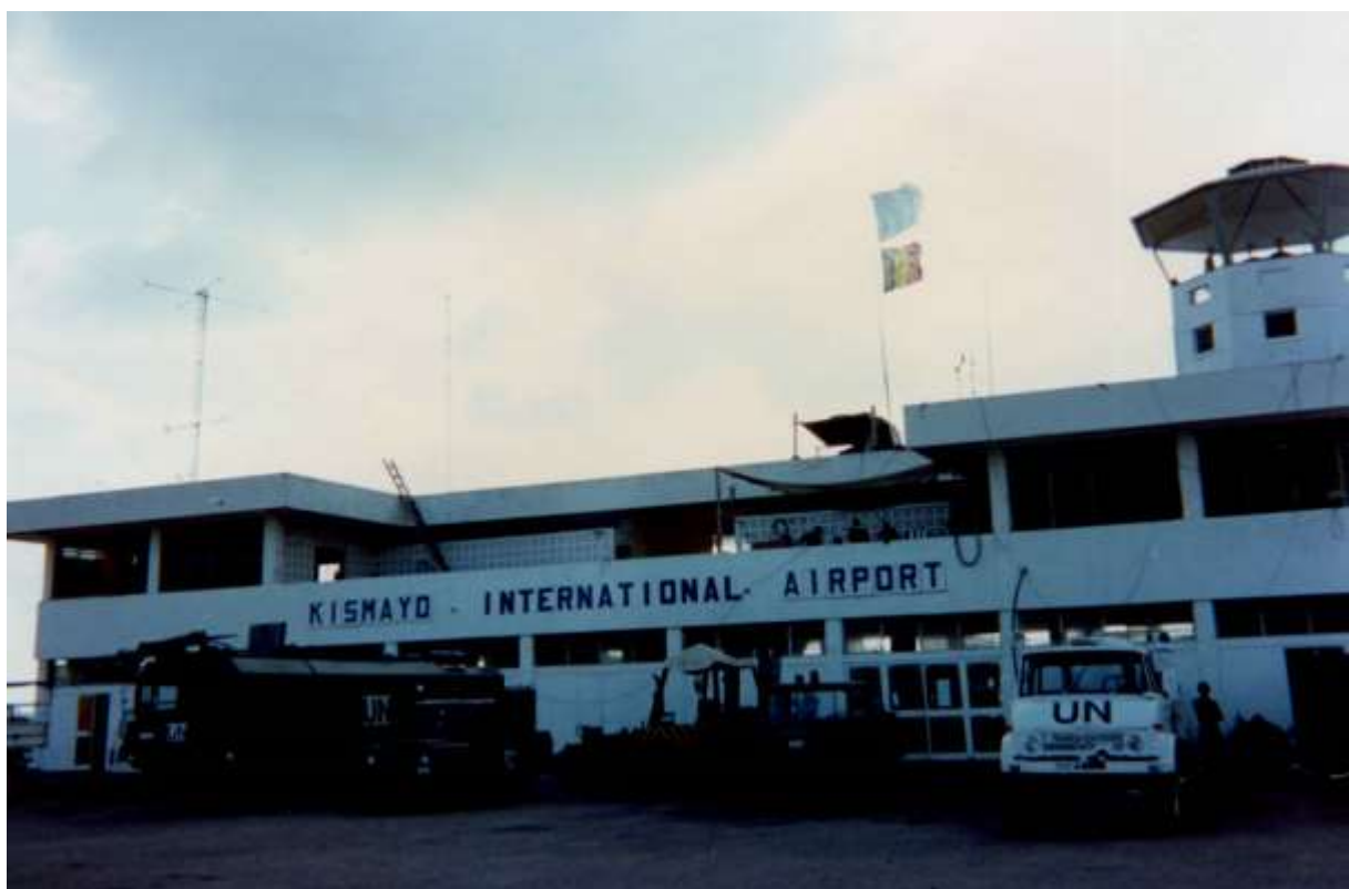
Vliegveld van KISMAYO.